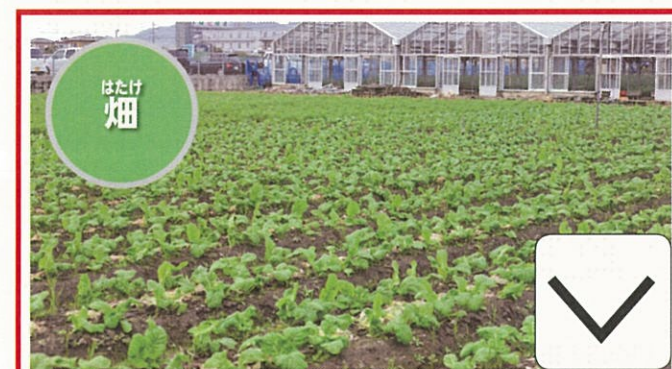
しよくふつ 植物の二まいの葉 (ふたば) を記号にしたもの。