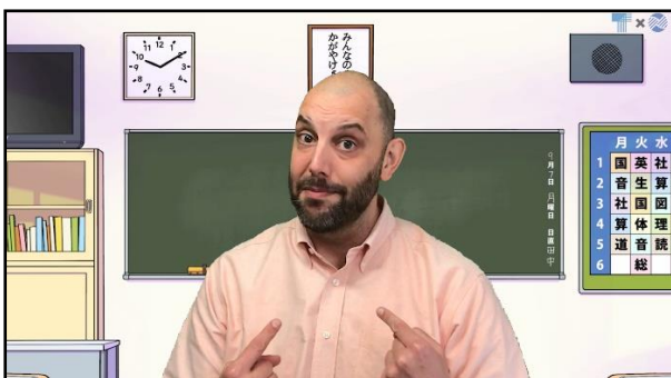
○人気ALTによる楽しく分かりやすい動画です。

5・6学年の各 Unit 1 について各2種類（合計4種類）の動画（1本各約3分）を制作。いずれも東京書籍の指導者用デジタル教材の映像などをもとに、学習する活動や言語材料などをインタラック所属のALTがわかりやすく解説しています。