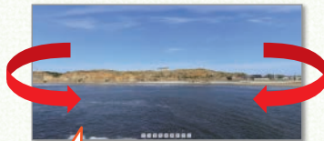
地層のつながりを確認することができるコンテンツ

360°パノラマ写真などの技術を使って、まるでその場にいるかのような感覚を持たせ、新たな発見を促すことができます。