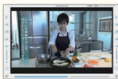
プロに聞く(家庭分野)

さまざまな分野で活躍する人のインタビューを通して、ものづくりの面白さや働く人の思いを伝えます。