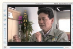
技術の匠(技術分野)

●掲載している画面・機能は開発中のもので、仕様は予告なく変更する場合があります。