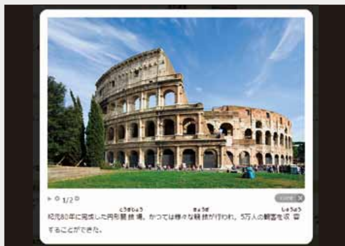
イタリア、ローマのコロッセオ（世界文化遺産）