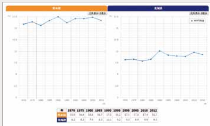
熊本と北海道の平均気温の比較